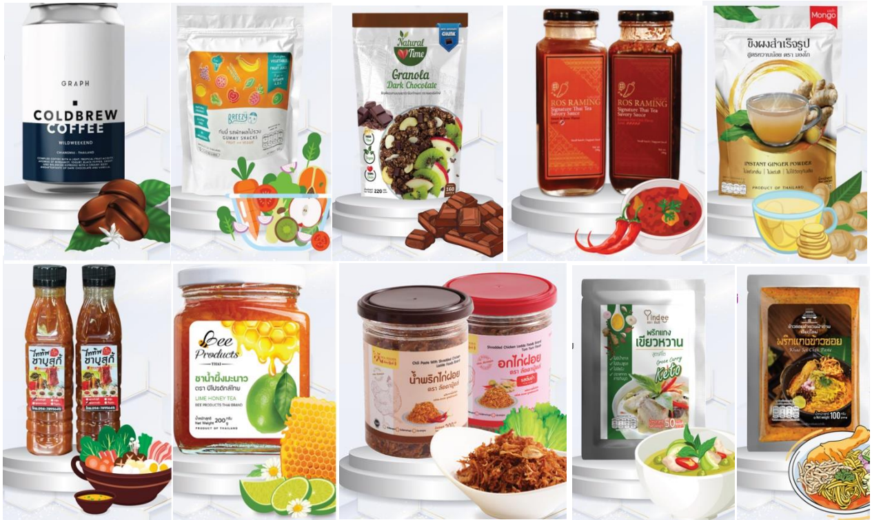
ภาพตัวอย่างผลิตภัณฑ์ภายในโครงการ

ลิงค์สนับสนุนโครงการ: https://www.facebook.com/FIN.CMU/photos/pb.100064893902424.-2207520000.../3079294642311197/?type=3