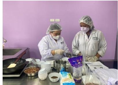
ภาพการดำเนินงานภายในโครงการ